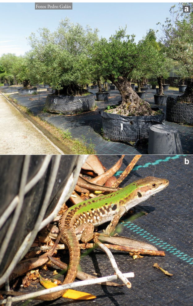
Figura 1: Vivero de plantas ornamentales de Bergondo (A Coruña). a) Olivos en el vivero, donde se puede apreciar que muchos de estos árboles poseen troncos gruesos con numerosos orificios, en los que presuntamente se ocultó la lagartija italiana, siendo transportada con ellos. b) Hembra adulta de Podarcis siculus al pie de uno de los contenedores de tierra de los olivos del vivero.

El 4 junio de 2024, dos de las coautoras (ST y MA) observaron en un vivero comercial dedicado a la venta de plantas ornamentales, con profusa presencia de olivos, una lagartija en apariencia diferente de la Podarcis bocagei típica de la zona. Gracias a las fotografías que obtuvieron, pudo ser identificada como lagartija italiana, Podarcis siculus . Este vivero se encuentra situado en la localidad de Ouces, (ayuntamiento de Bergondo, provincia de A Coruña; UTM 1x1 km: 29T NH 6198; 18 msnm).