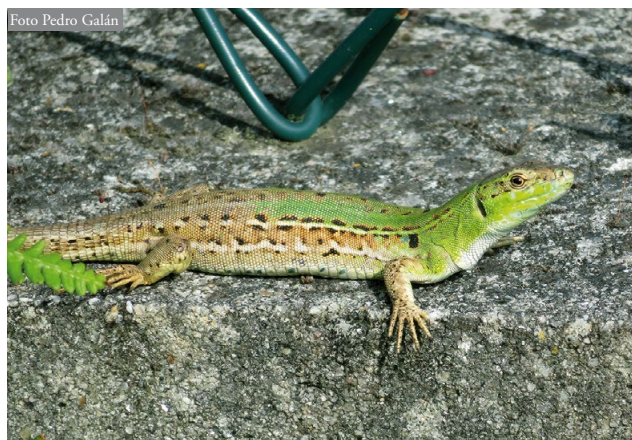
Figura 4: Hembra adulta de Podarcis siculus en el muro periférico del vivero, mostrando signos de gravidez (abdomen dilatado, con presencia de huevos oviductales).

Un hecho a destacar es que en el interior del área ocupada por Podarcis siculus no se observó a ninguna Podarcis bocagei , la especie de este género autóctona de la zona. Aunque no se dispone de datos previos de la presencia de la lagartija de Bocage en el vivero ni en su periferia, se puede especular razonablemente que estuvo presente en estas zonas antes de la introducción de la lagartija italiana. Los puntos donde fue observada Podarcis bocagei estaban fuera del área donde se ha expandido la lagartija italiana (Figura 3). Sólo se observaron ejemplares próximos de P. bocagei a P. siculus en la periferia del área ocupada por esta última, en los sectores norte, oeste y sur de la zona, a lo largo de muros de fincas (Figura 3).