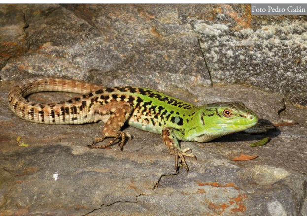
Figura 2: Macho adulto de Podarcis siculus de la población de Bergondo (A Coruña, Galicia), fotografiado en la periferia del vivero de plantas ornamentales.

no pudieron ser sexados (Figura 2). Los ejemplares observados en puntos más extremos de la zona se encontraban separados por distancias en línea recta de 592 m en un eje noreste-suroeste; 453 m en un eje este-oeste y 430 m en un eje noroeste-sureste (Figura 3). La superficie total entre estos puntos extremos de observación, calculada a partir del polígono creado conectando estos puntos periféricos, es de 11,42 hectáreas. El rango de altitudes de es-